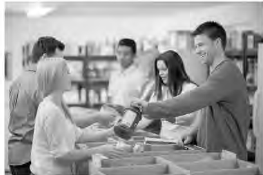
Hilfe für Asylanten