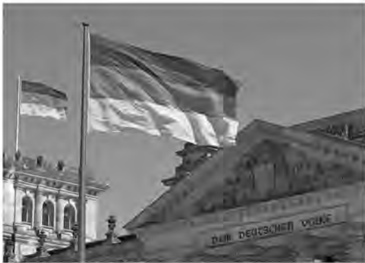
Überall in Deutschland ein Feiertag