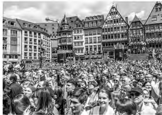
Abendveranstaltung in Frankfurt zum 25. Jahrestag der Wiedervereinigung