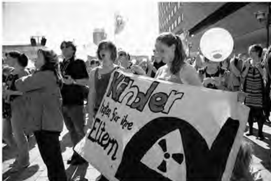
Jugendbewegung gegen Atomkraft